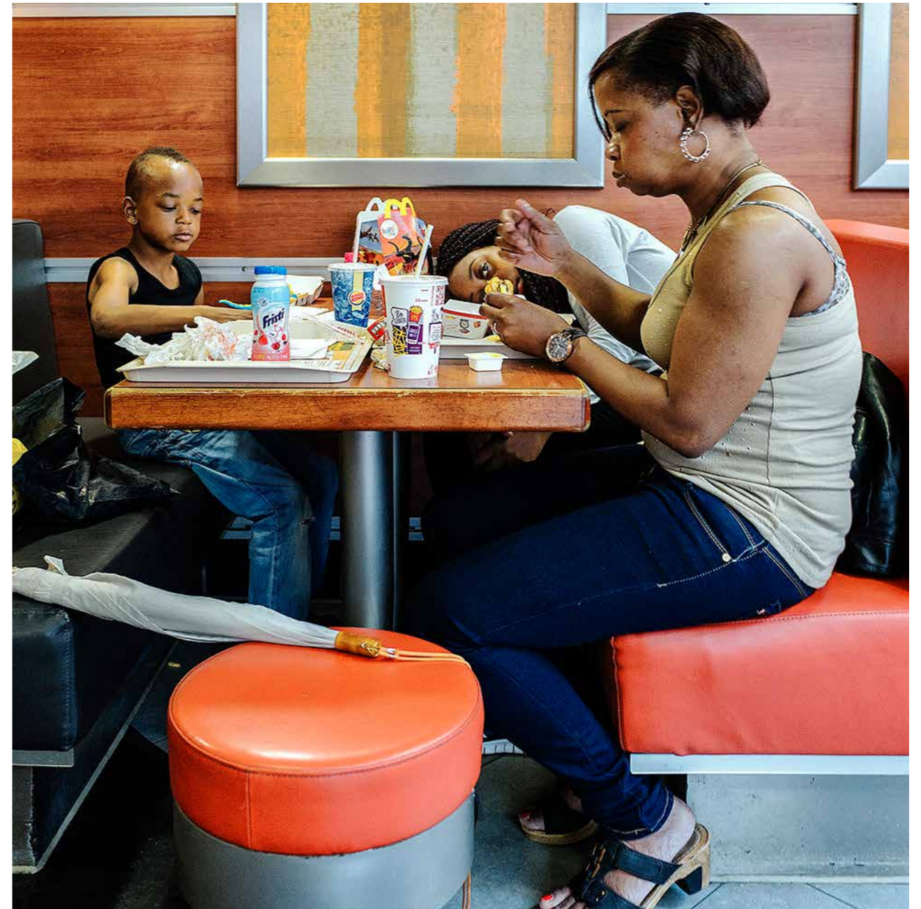
[food and drinks amsterdam 2014]

W elke boeken over straatfotografie, of van straatfotografen wil je graag aanraden?