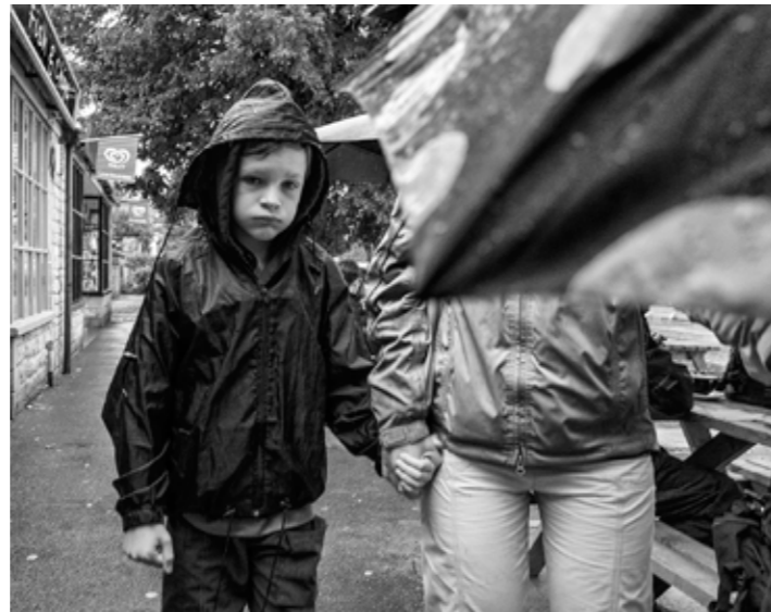
[bad weather bedford 2014]