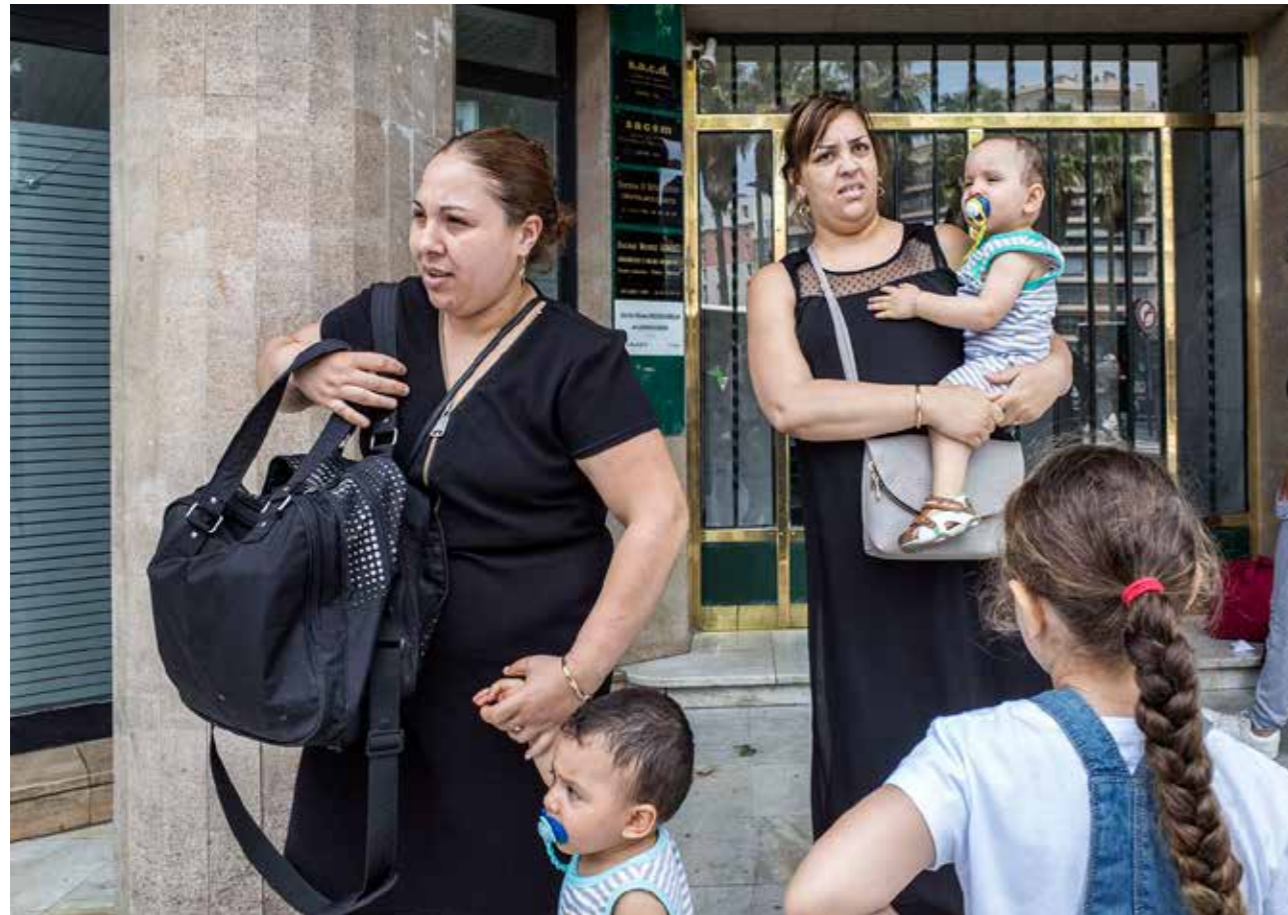
[family malaga 2015]

W aarom trekt deze fotografievorm je aan?