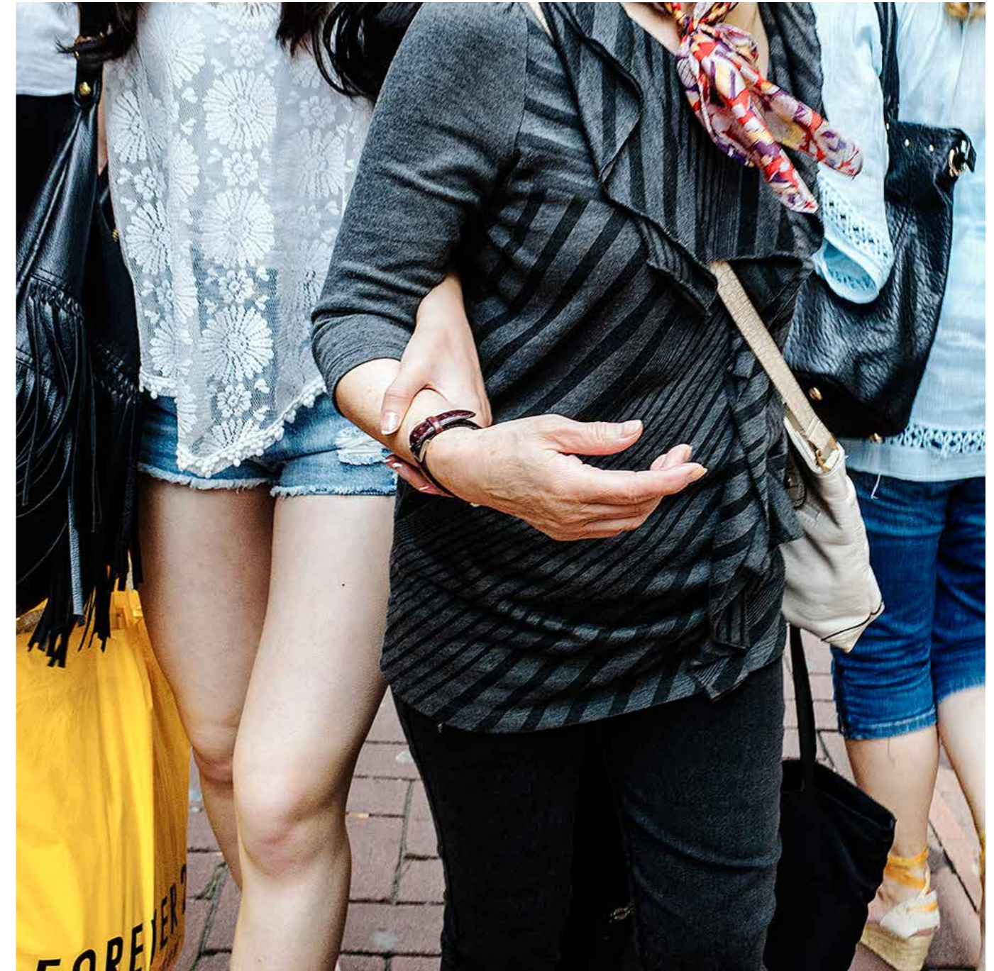
[straatbeeld amsterdam 2015]