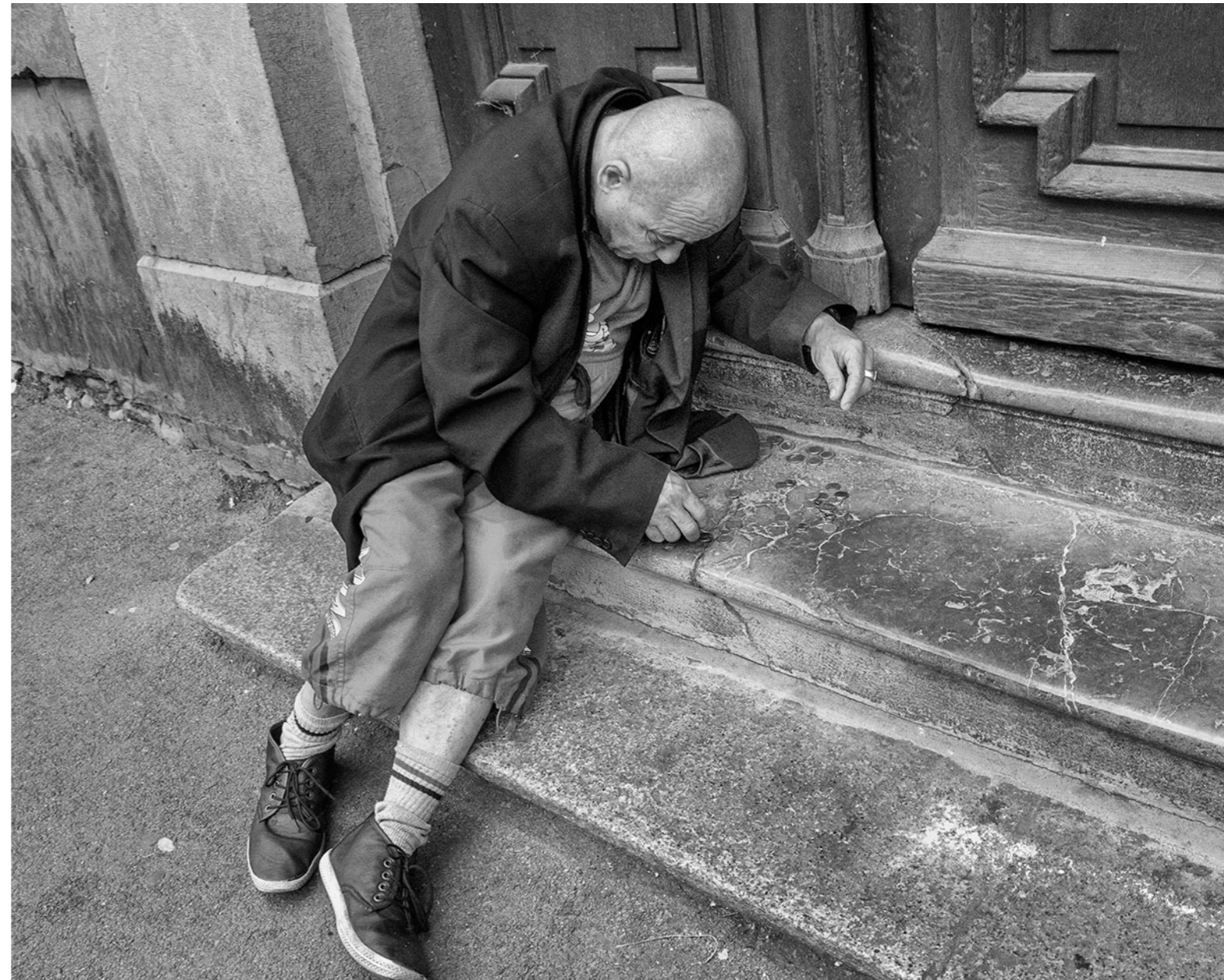
[money perpignan 2015]

Eigenlijk alle locaties waar mensen zijn. Ik werk thematisch aan enkele langlopende specifieke projecten maar daarover later. Binnen de 'straatfotografie', die voor mij niet beperkt is tot de feitelijke straat, ga ik vaak wel te werk volgens een idee; zo iets als een basis voor die dag. Zo zal ik bijvoorbeeld op een regionale motorcross niet de crossers of de wedstrijden fotograferen maar juist de dingen eromheen; de gapende EHBO-er in de ene foto en in de andere de supporters, fanatiek juichend en met spanning op het gezicht. In een kathedraal zal ik niet snel de lichtval door het glas-in-loodraam fotograferen maar wel de diep in gedachten verzonken gelovige.