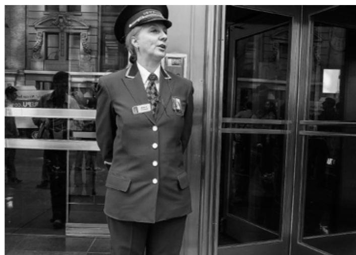
[portiers new york 2012]