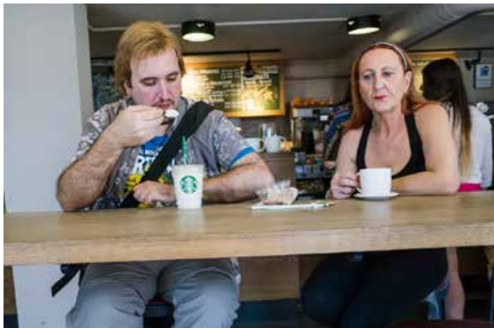
[food and driks malaga 2015]